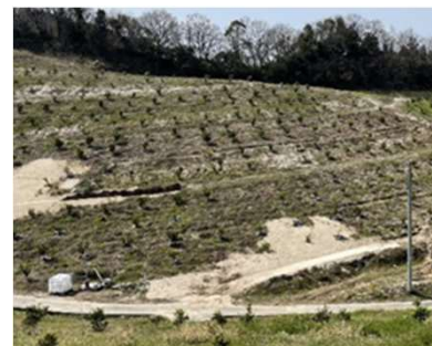
荒廃農地解消の様子 （松山市立岩地区）