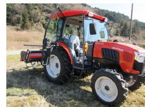
事業で導入した機器