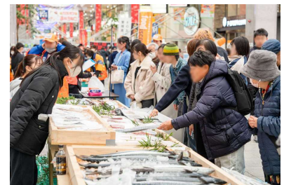
「えひめの食」体験イベント