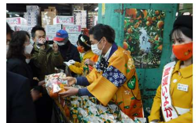
市場トップセールス