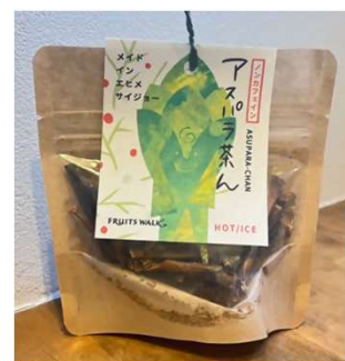
開発された新商品例