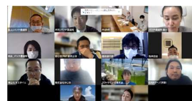
オンライン商談会の様子