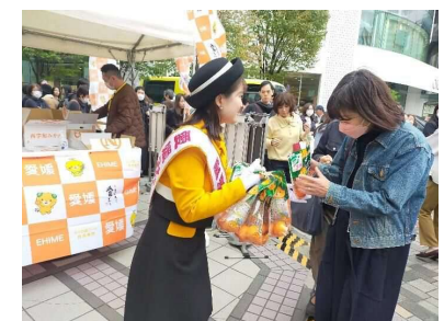
東京・有楽町愛媛県産みかん サンプルイベントの実施