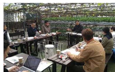
人材育成研修会の様子