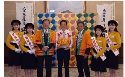
愛媛みかん大使 表敬訪問