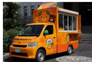
EHIMEみきゃんずキッチン