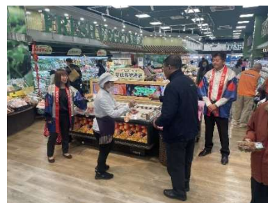
台湾「裕毛屋」での 県産かんきつPR