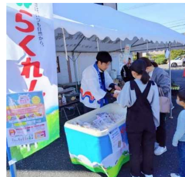
県産牛乳のイベントPR