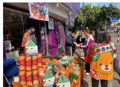
ベトナム「KLEVER FRUIT」 でのプロモーション