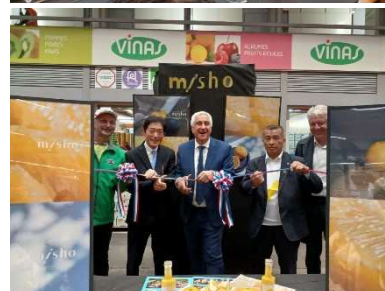
欧州向け河内晩柑（misho） の現地プロモーション