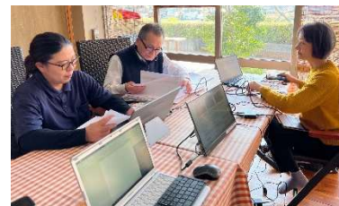
事業者支援の結果例