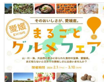
グルメサイトと連携した飲食店フェア