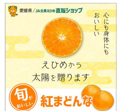
WEBバナー広告の配信