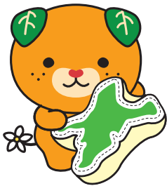
愛媛県イメージアップ キャラクター みぎやん