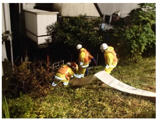
砥部川右岸 (高尾田20番地地先) 排水ホース設置