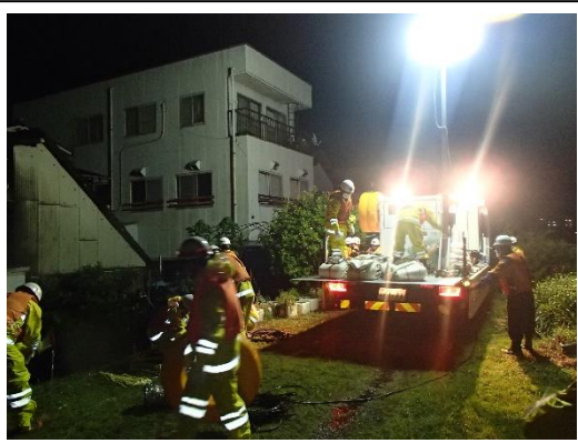
砥部川右岸 (高尾田20番地地先) 排水ポンプ車到着