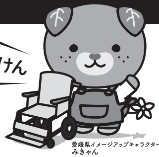
愛媛県イメージアップキャラクター みきちゃん