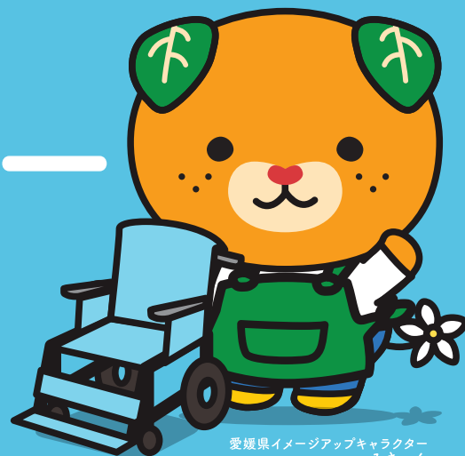
愛媛県イメージアップキャラクター みきゃん