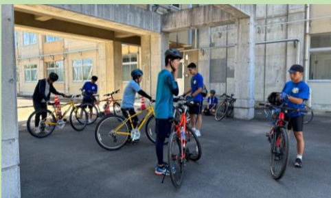
▲ ツアーリハーサルの様子

土居高校 地域デザイン部は、 自転車を利用して、地域を活性化させるための活 動をしています。 交通安全教室やサイクリング大会を実施しました。 また、2023年の第3回自転車甲子園では、 最優秀賞を受賞しました!