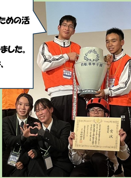
▲ 第3回自転車甲子園(2023年12月)