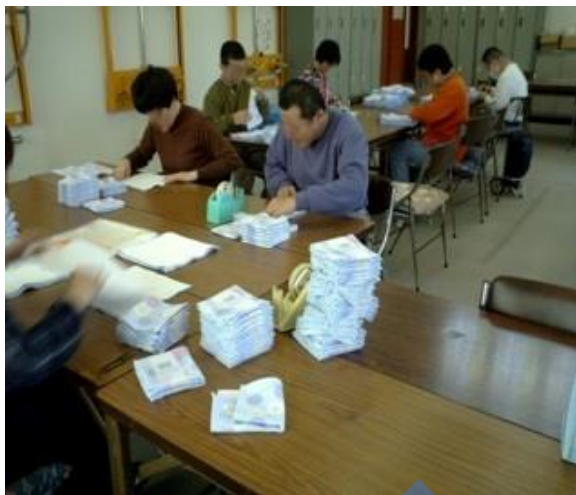
タオルの検品 (今治市障害者福祉支援センターのぞみ苑)