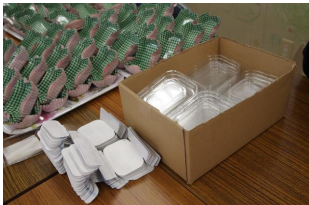
カップ作業（i-プロジェクト）