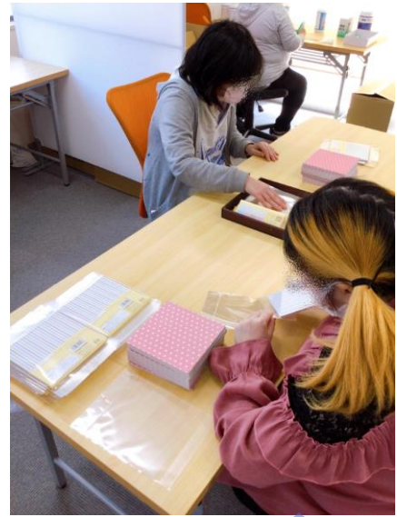
内職作業（ベスナ・プラス）