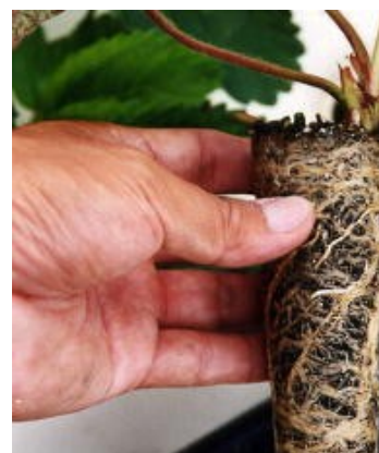
写真2 ポット底面に根が詰まった状態