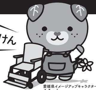
愛媛県イメージアップキャラクター みきちゃん