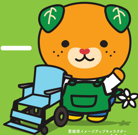
愛媛県イメージアップキャラクター みきゃん