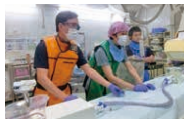
心臓カテーテルシミュレータ実習の様子