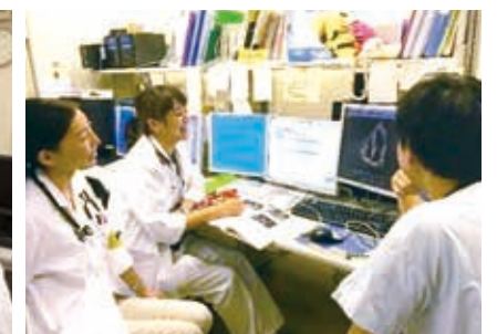
心臓超音波カンファレンス風景