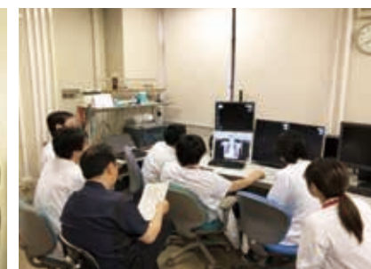
救急明けカンファレンス風景