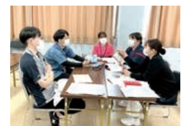
グループワークのひとつ

今年度の新規入職者は18名。多職種合同で3日間の研修を受けました。十全八十八箇所巡りでは、院内の88ヶ所のポイントを巡りながらミッションをクリアする中で、院内の場所を覚え、これから共に働くたくさんのスタッフに会うことができました。