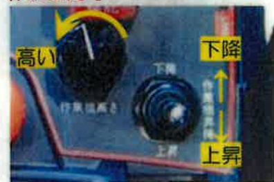
作業機昇降スイッチ