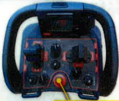
緊急停止スイッチ