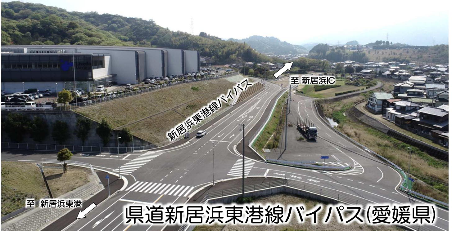
県道新居浜東港線バイパス(愛媛県)