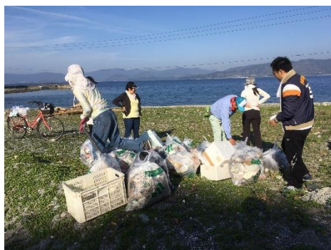
海岸のゴミ清掃のお手伝い