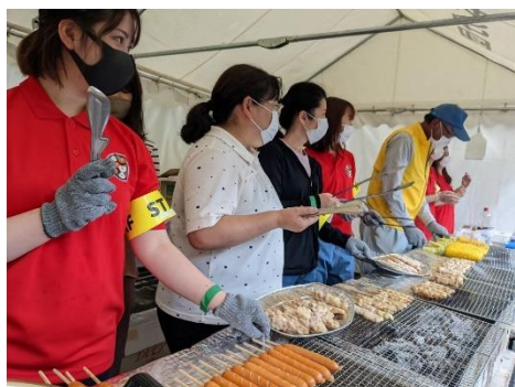
集落のイベントサポート