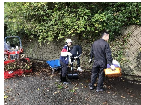
生活道路の保全・草刈り