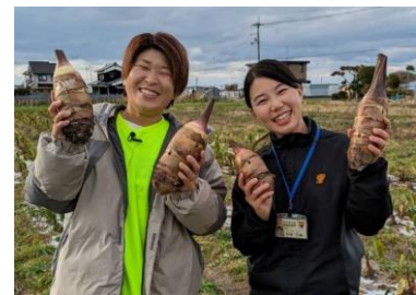
図1 産地化を進める「媛かぐや」