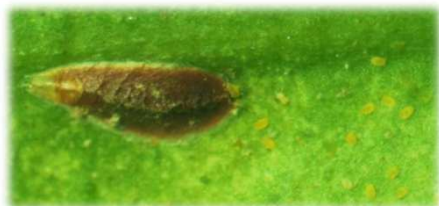
雌成虫と孵化幼虫(体色黄色)

ヤノネカイガラムシの薬剤防除適期は、 第1世代は、第1世代幼虫初発日の30~35日後(アブロード剤、モベントフロアブルは20~25日後) です。 第2世代は、第2世代幼虫初発日の30日後頃 です。