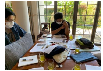
個別商品開発会議