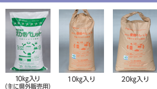
10kg入り (主に県外販売用) 10kg入り 20kg入り