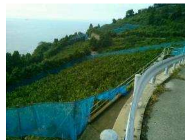
農地中間管理事業を活用した果樹園地