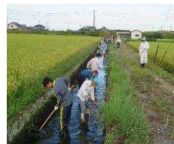
水路清掃活動の様子