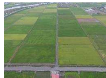
区画整理後の水田