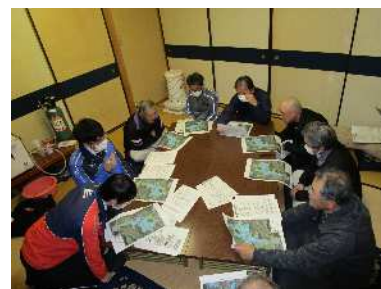
地域での話し合い