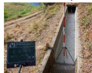
水利施設の機能回復