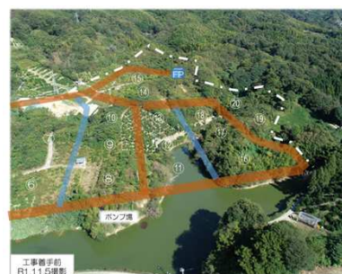
樹園地の基盤整備