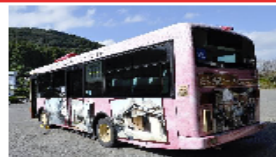
運行するラッピングバス

市内への観光客を増加させるために、市の観光スポットをラッピングしたバスが県内を走行します。11月1日（水）には、 ラッピングバス の出発式があり、大勢の参加者が鮮やかに描かれたバスに見入っていました。バスの側面には、白壁土蔵など歴史的町並みが残る「 肥前浜宿 」とラムサール条約登録地である「 肥前鹿島干潟 」を、背面には、鹿島市の一大イベントである「 鹿島酒蔵ツーリズム 」が描かれています。バスは、路線バスとして、佐賀市や武雄市、嬉野市などへの路線を走行して、鹿島市の観光PRに貢献してくれそうです。