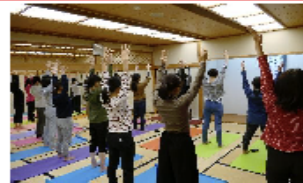
「ヨカと鹿島の食べ物でテトリス」のワークショップ

11月26日(日)、世界的にも貴重なラムサール条約湿地に登録された「 肥前鹿島干潟 」がある鹿島市の生涯学習センターエイブルで、「食」をテーマにしたシンポジウムが開催されました。当日は、鹿島の食材を使用した「 食と美のワークショップ 」や「 マロン氏(フードスタイリスト)の講演 」、「 野菜スープのふるまい 」などのイベントに多くの方が参加され賑わいました。有明海の恵みを受けた食文化の魅力が発信されたこのシンポジウムを通して、私たちの身近な海である 有明海の再生・保全 についての理解が深まったことと思います。