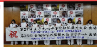
西部中陸上部の選手たち

11月10日(金)に開催された県中学校駅伝競走大会の女子の部で、 鹿島西部中学校 が見事優勝に輝きました。女子は 5区間12km を競い、西部中のタイムは、 42分47秒 で、2位の嬉野中学校とは49秒差でした。今後、 12月17日(日) に滋賀県野洲市で開催される 全国中学校駅伝大会へ出場 されます。11月17日(金)には、出場選手たちから、市長へ優勝と全国大会への出場報告に訪問されました。今後のご活躍を祈念いたします。