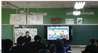
財政教育プログラムの様子

11月27日(月)、 県内中学校では初めてとなる特別授業「財政教育プログラム」 が、鹿島西部中学校で行われました。「財政教育プログラム」とは、子どもたちが国の財政について学ぶなかで、国のあり方について広く興味を持ってもらい、自分たちの国の未来について考え、判断できる子どもたちを育成することを目的とされています。当日の授業では、3年生の1クラスが、財務省福岡財務支局佐賀財務事務所から「日本の財政」について学んだ後、グループに分かれ、財務大臣になったつもりで、 仮想による国の予算編成 を行い、その 予算編成の項目や理由などについて発表 を行いました。生徒たちにとって、自分の住む地域や国の将来について考えるよいきっかけとなり、有意義な授業になったことと思います。