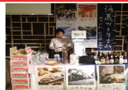
鹿島市のPRブースの様子

10月30日（月）に、東京都白金台の「八芳園」において、「 佐賀さいこう！応援団 」交流会が開催されました。「佐賀さいこう！応援団」は、首都圏での佐賀県情報発信の強化、県産品の販売強化等を目的に、「佐賀が好き、佐賀を応援したい」という思いを持つ方々で昨年結成されました。当日は、樋口市長も出席し、 約500人 の参加者でにぎわいました。鹿島市のPRブースでは、観光や物産紹介のほか、人的ネットワークの構築のため、PR活動をおこないました。