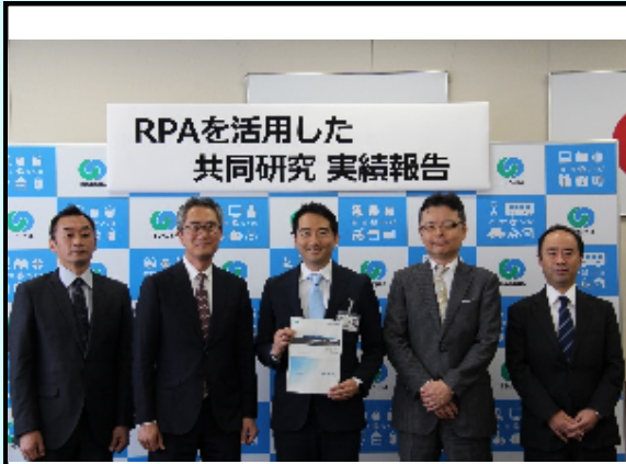
5月10日に記者発表を行いました