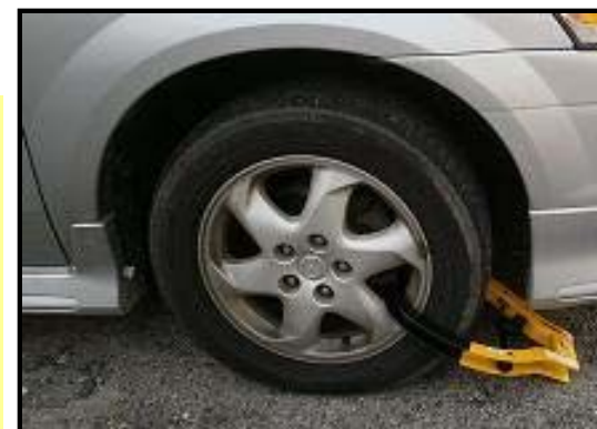
自動車のタイヤロック・公売も実施

http://www.city.niihama.lg.jp/soshiki/kakuka.php?sec_sec1=134