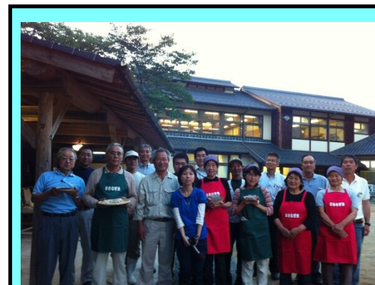
廃校を活用し交流事業を展開する地域