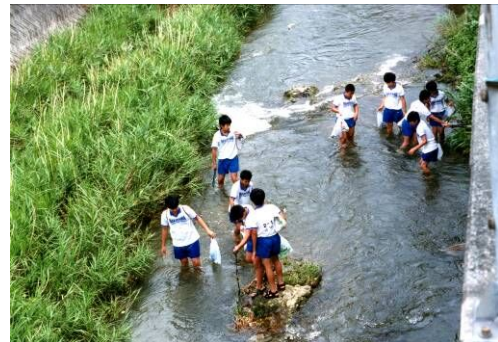
愛リバー・サポーター活動