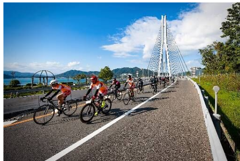
サイクリングしまなみ

瀬戸内海に特有な景観を活用して、都市住民を含む市民が海や自然の保護に配慮しつつ自然等とふれあい、これらについての知識や理解が深まるよう、近隣県の関係団体と連携し、エコツーリズム推進法（平成19年法律第105号）に基づいたエコツーリズム推進に努めるものとする。この際、独自の景観を残している島しょ部をはじめ、しまなみ海道とその周辺、スナメリやカブトガニといった地域の保全活動等を象徴する生物など地域が持つ特有の魅力を再評価すると同時に、地域の活性化にもつながるよう努めるものとする。