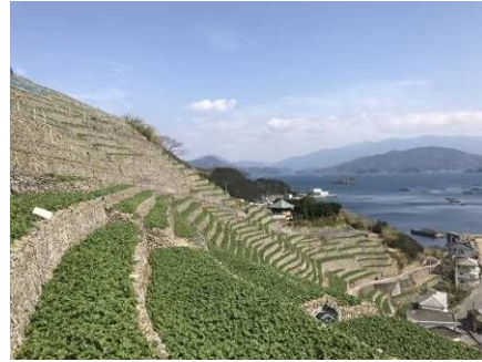
遊子水荷浦の段畑