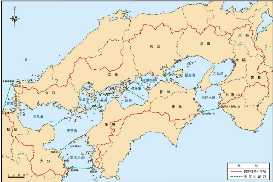
瀬戸内海環境保全特別措置法による対象区域