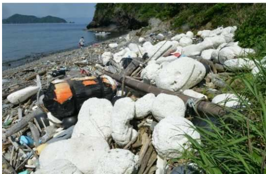
立入困難海岸の漂着ごみ

また、海上に浮遊するごみ、油等を回収するため、松山港及び三島川之江港に配備されている清掃船並びに松山港及び菊間港に配備されている油回収船を積極的に活用していくものとする。