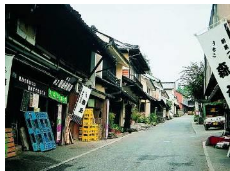
【内子町の町並みと和ろうそく】