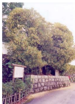
【西条王至森寺の金木屋】