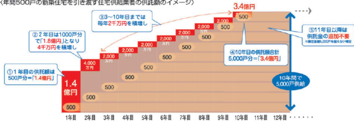
〈年間500戸の新築住宅を引き渡す住宅供給業者の供託額のイメージ〉