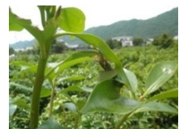
ハマキムシの被害と葉の中の幼虫