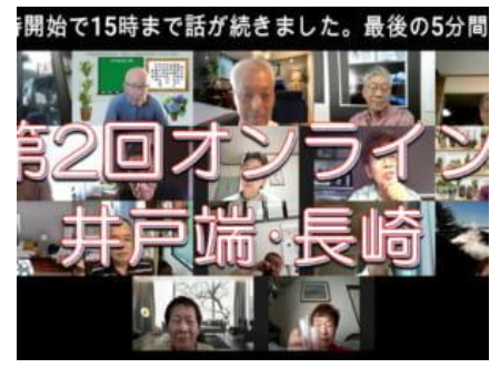
(オンラインイベントの様子)

累計閲覧数は 28,668 回。一日平均では 55 回と年に一度の大型イベントの際に大きく伸びる以外はこれまで安定した閲覧数で推移してきた。まちづくり支援係は、閲覧数を落とさないために専用サイトの固定ファンをつくること、さらに閲覧数を伸ばすための新規ユーザーの獲得を目指し、年ごとに閲覧者数と掲載件数の目標値を設定しており、令和 3 年度は閲覧者数目標 2,352 人/月に対して 1,654 人/月、掲載件数目標 40 件/月に対して 39 件という結果であった。