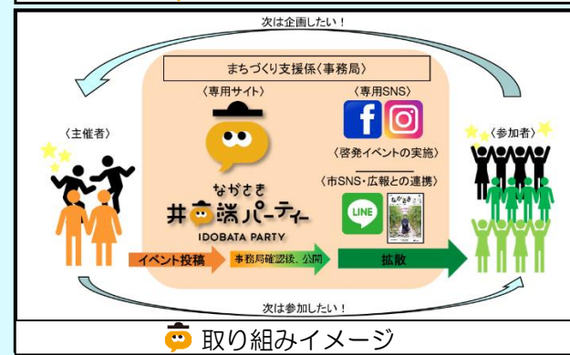
取り組みイメージ