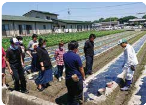
農作業体験マッチング(枝豆)