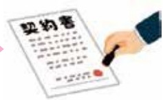
契約 (最低賃金にて契約)