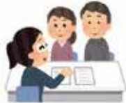
中予地方局 地域農業育成室に相談