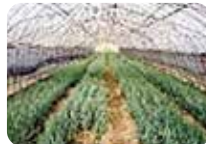
ハウスの休閑期を活用して ネギ栽培を開始