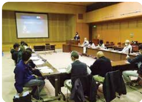
農業版ジョブコーチ育成研修会

このため、本県では農福連携を推進するため「農福連携ビジネス推進事業」により、農業者と障害者就労施設等を対象とした研修会や農業者と障害者就労施設との農作業体験マッチング、農業版ジョブコーチの育成等に取り組んでいます。