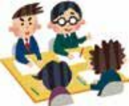
南予地方局 地域農業育成室に相談