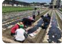
農作業体験 (枝豆の播種作業)