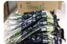
出荷はJAへ (年間売上実績約100万円)