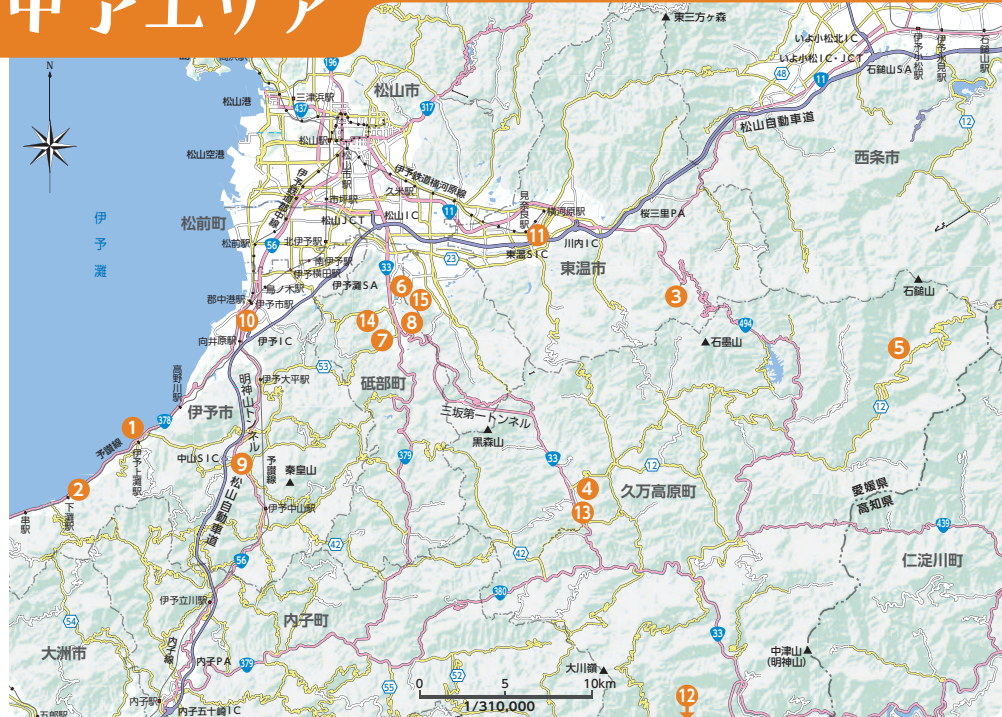
地図の作成に当たっては国土地理院発行の数値地図（国土基本情報20万）を使用しました。