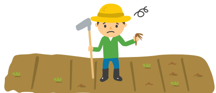
しゅってんかんきょうしょう ちきゅうおんだんか 出典：環境省「おしえて！地球温暖化」

いじょう きしじょう のうさくぶつ しゅうかくりょう 異常気象による農作物の収穫量の げんしょう ひんしつ てい か お 減少や品質の低下が起こる。