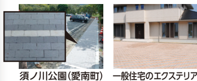
須ノ川公園(愛南町) 一般住宅のエクステリア