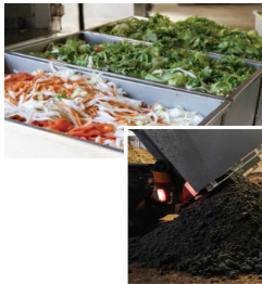
①食品残渣・汚泥の受入