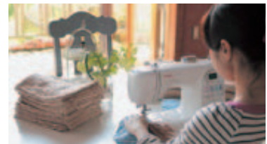
家事や育児優先の在宅勤務の導入