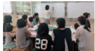
女性を対象にしたセミナーの実施