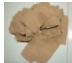
発生したハギレは別の商品に活用