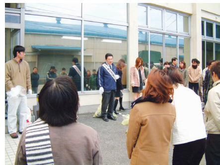
社員による清掃奉仕活動